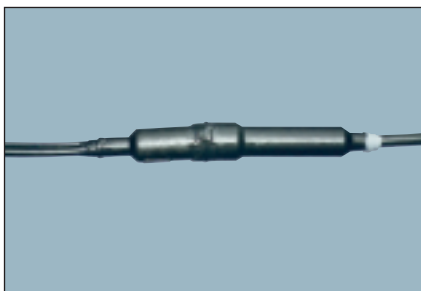
На сросток надвигаются полумуфты, стыки обматываются мастикой и виниловой лентой