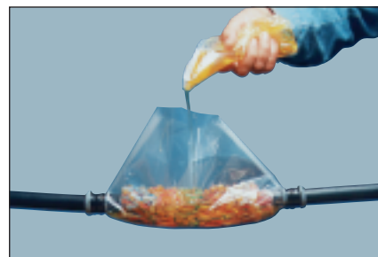
Сросток оборачивается куском специальной пленки, в получившийся конверт заливается компаунд 4442