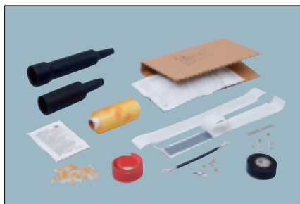
Комплект монтажа муфт ВССК и МВССК