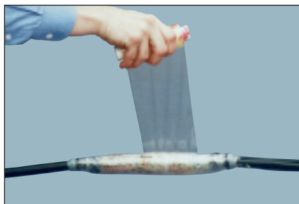
Компаунд сдавливается путем обмотки сростка эластичной виниловой лентой