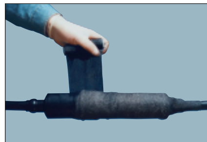
При необходимости в повышенной жесткости муфты, весь корпус муфты обматывается лентой Арморкаст™ (включается в набор по требованию)