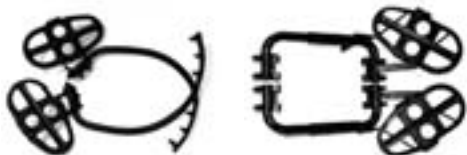
Когти раздвижные КРПО

Лазы универсальные предназначены для работы на железобетонных опорах трапециевидного сечения воздушных линий электропередач типа СВ 110-1а; СВ 95-1а (2а); СВ 105-3,6; СВ105-5. Масса: не более 5 кг.