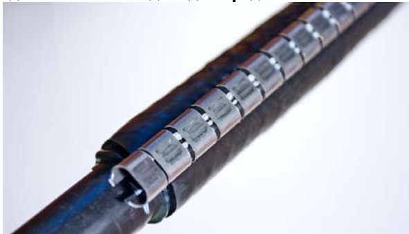
Рис. 3. Белые полосы в прорезях застёжки.