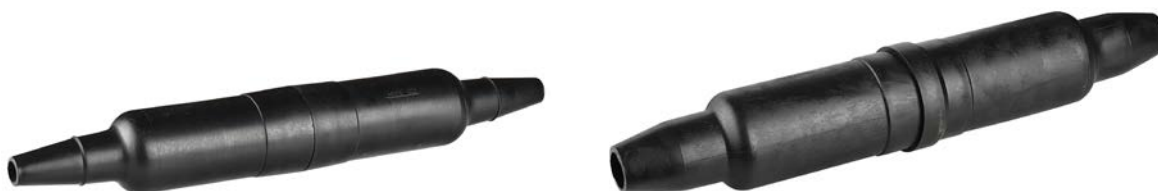
Рис. 1. Внешний вид муфт типа МПП.

2.1. Муфта типа МПП представляет собой полиэтиленовую муфту, с корпусом из двух полумуфт. На каждой полумуфте на одной стороне имеется конус. Внешний вид муфт представлен на рис. 1.